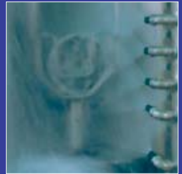
2 Washing chambers 2 chambres de lavage