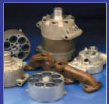
Typical components Pièces typiques