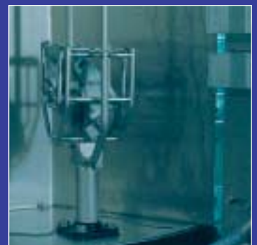
2 Drying chambers 2 chambres de séchage